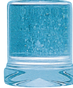
Tam buz küpü Ø 27 x 32 mm · Ağırlık 18 g.

Smart-Line buz üretim sistemi 27 x 32 mm formatında silindirik tam buz küpleri üretmektedir. Buz küpleri berrak ve sağlamdır. Bu seri, günde 18 kg'lık (yakl. 1000 adet) ile 58 kg'lık (yakl. 3200 adet) arası bir performans arayan küçük ila orta ihtiyaçlı kullanıcılar için ucuz çözümler sunar.