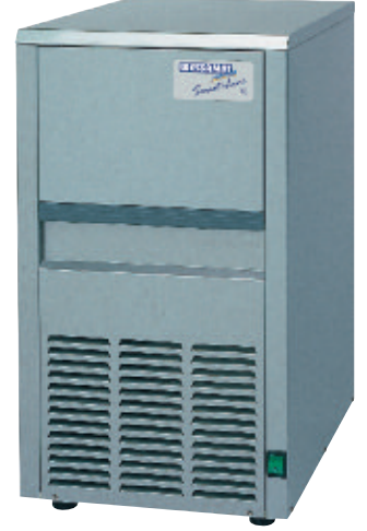
Res. model S 18 L / W